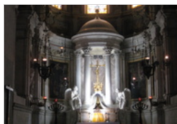
AFFRESCHI DELLA CAPPELLA LERCARI CATTEDRALE DI SAN LORENZO