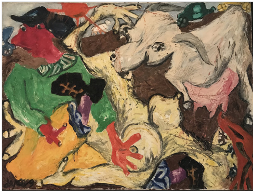
Jacqueline De Long, L'insurgée de l'art , 2019.