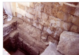
IPOGEO PALMIERI LECCE