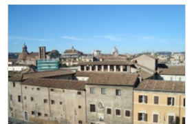
MONASTERO TOR DE SPECCHI ROMA