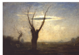
APRILE GAM - GALLERIA CIVICA D'ARTE MODERNA E CONTEMPORANEA