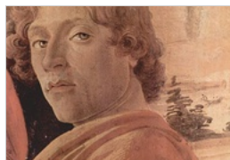
ALESSANDRO DI MARIANO DI VANNI FILIPEPI (BOTTICELLI)